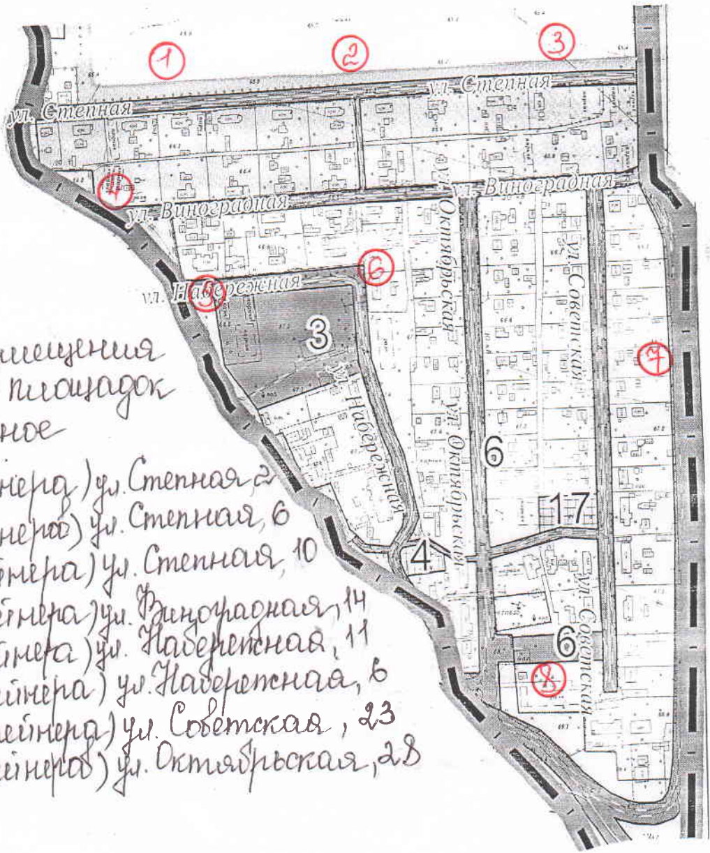
Схема размещения контейнерных площадок с. Офицерное